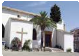
Iglesia del Dulce Nombre de Jesús.