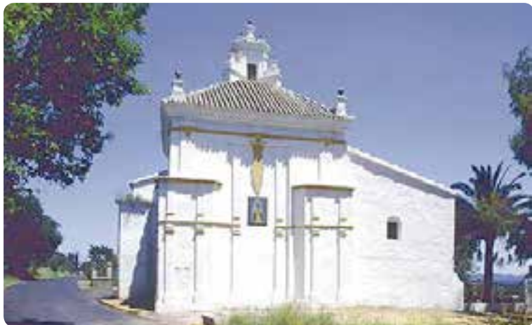
Ermita Virgen del Espino.