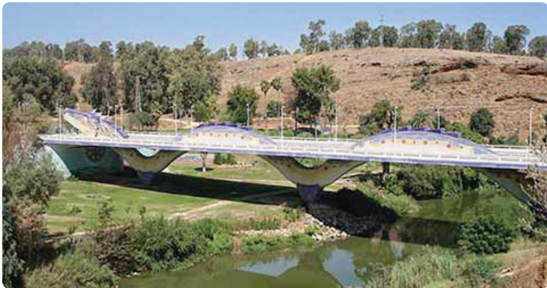
Puente del Dragón, Alcalá de Guadaíra.

Abandonamos este municipio siguiendo un camino muy transitado que nos lleva hasta la Balsa de Melendo , bordeándola y a partir de ahí seguiremos la canal que nos acompañará en gran parte del camino. Una vez abandonada la canal nos encontraremos con una zona de tierras bajas y fácilmente inundables en épocas de lluvia que podrían dificultarnos el tránsito. En este punto nos sirve de referencia unos establos abandonados a los que tenemos que llegar para poder seguir la ruta. Pasada esta zona cruzaremos el paso elevado