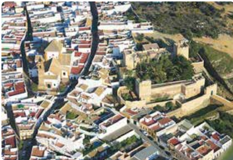
Vista aérea de Mairena del Alcor.