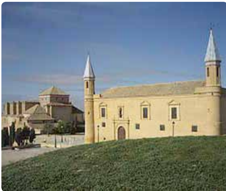
Universidad y Colegiata, Osuna.

De su rico pasado conserva una amplia muestra monumental y artística: la Universidad , la insigne iglesia Colegial , donde podemos contemplar el conocidísimo Cristo de la Misericordia de Juan de Mesa; casas y palacios; y por supuesto sus iglesias y coventos, como San Agustín , Santa Catalina , la Merced , la Concepción , la Encarnación , con la extraordinaria belleza de los azulejos sevillanos, etcétera.