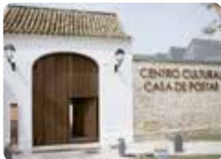
Centro Cultural Casa de Postas, El Cuervo de Sevilla.