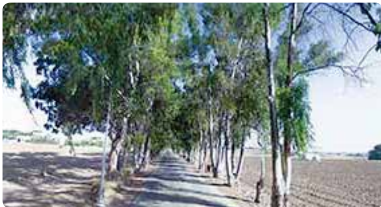
De Estepa a El Rubio.