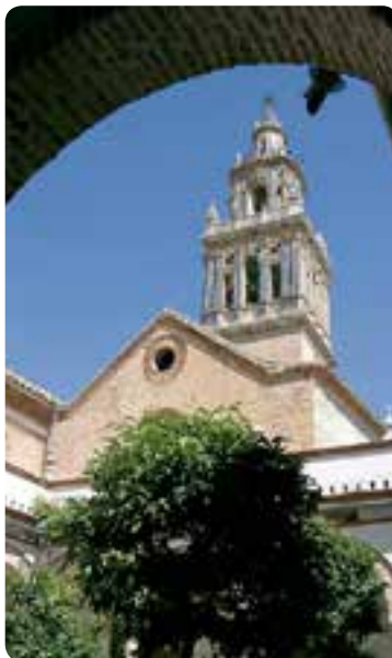
Iglesia de Santa María, Écija.