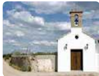
Ermita de San Isidro, La Salada (Estepa).