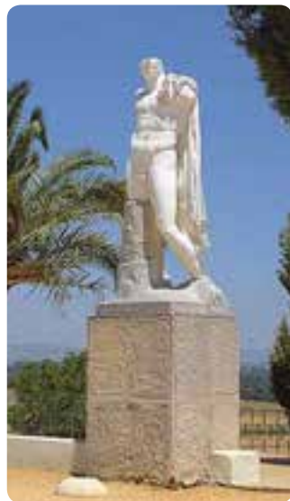
Monumento a Trajano, Conjunto Arqueológico de Itálica, Santiponce.