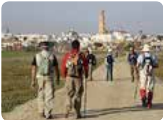
Entrando en Utrera.