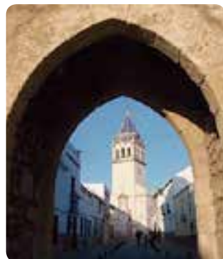
Iglesia de Ntra. Sra. de Consolación.