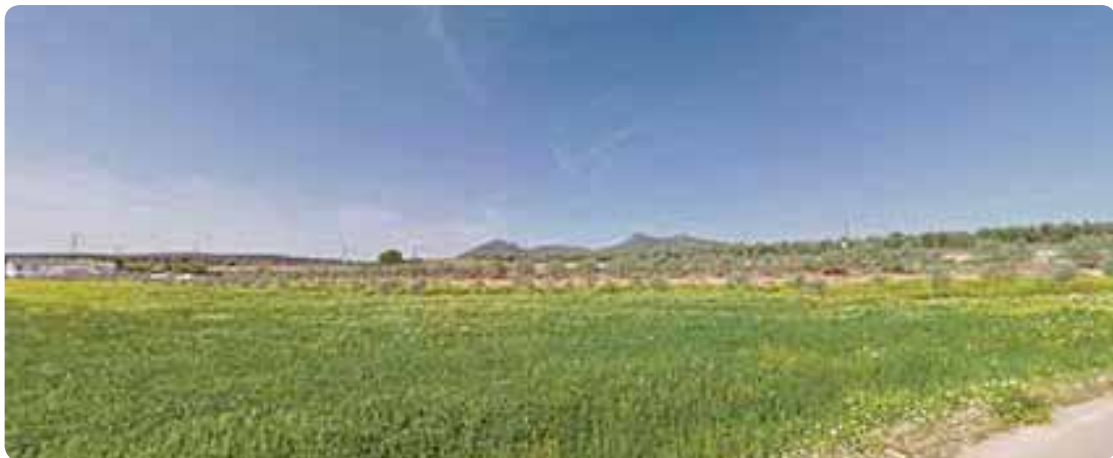
La Sierra Sur y La Campiña se mezclan en este recorrido.

Tras disfrutar del entorno de la laguna de Fuente de Piedra, avanzamos por el camino del cerro de la Virgen hacia Las Albinas para alcanzar la cañada real de Sevilla a Antequera. Conectaremos con la vía de servicio de la autovía A-92 durante un breve tramo para llegar por el camino de Marcos hasta la localidad sevillana de La Roda de Andalucía . Ésta se localiza en el extremo suroeste de la provincia sevillana, posee una ubicación idónea en el interior de la cuenca del Guadalquivir y en el borde de la cadena serrana Subbética. En este municipio ferroviario cruzaremos el arroyo Salinoso y seguiremos el cauce del río Yeguas flanqueados al poniente por las sierras de Pleités (725 m.) y Piedra del Águila (711 m.). La llanura rodense nos ofrece una vista peculiar entre la rivera del Yeguas y las estribaciones de la serranía ostipense. Antes de alcanzar la antigua Ventippo pasaremos por la aldea de El Rigüelo ubicada en el margen izquierdo del río.