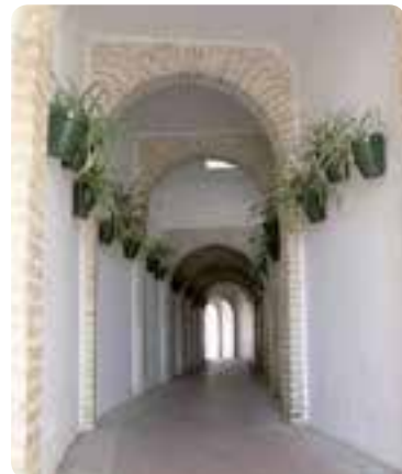
Callejón de Flores Pistón.

Entre sus edificaciones destacan el Callejón de Flores Pistón , la Fuente de la plaza del Fuero de las Colonias, la iglesia parroquial de Santa Ana y la ermita de la Virgen Milagrosa .