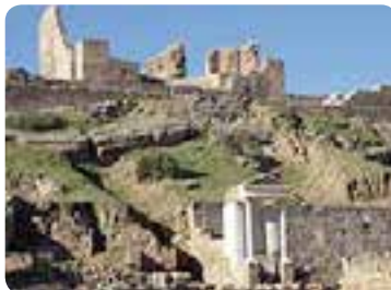
Conjunto arqueológico Mulva-Munigua.

Un poco más al norte, a orillas de la ribera del Huéznar, se asentaron íberos y romanos en Munigua , hoy Villanueva del Río y Minas. En los alrededores, la belleza de su paisaje de arroyos y veredas alivian el camino. La población aparece entre cultivos de algodón, maíz y olivares. Su acervo está representado por las iglesias de Santiago (con un artesonado mudéjar original) y de San Fernando , y, sobretudo, por el castillo de Mulva , donde encontramos la «Casa Atrium», única en España por su forma trapezoidal. Destacan también el Conjunto Histórico Minas de la Reunión .