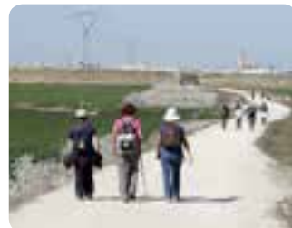
De Las Cabezas de San Juan a Utrera.