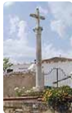
Crucero de piedra.

De su patrimonio histórico-cultural destacan la iglesia de San Sebastián y San Diego , la ermita de San Diego , el Crucero de piedra a la entrada de la población y el punto romano sobre el río Galindón.