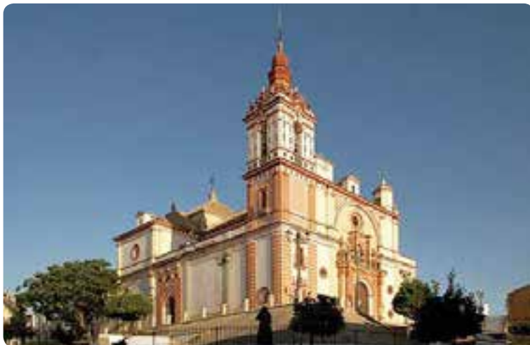
Iglesia de San Juan Bautista, Las Cabezas de San Juan.

De su arquitectura resalta un templo de grandes dimensiones y belleza situado en la parte alta del municipio donde antiguamente estaba la iglesia parroquial y el castillo, la iglesia de San Juan Bautista , del más puro estilo barroco; la iglesia de San Roque , junto a la plaza de los Mártires del Pueblo; y la Casa de los Valcárcel del siglo XVIII. En la actualidad esta población está hermanada con la asturiana Tineo, en el Camino Primitivo de Santiago.