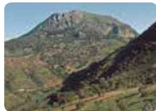
El Terril, Sierra del Tablón (Algámitas).