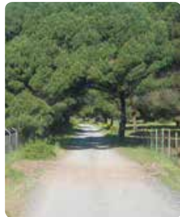
Entrando en la Sierra Norte.

De su legado artístico, cabe destacar la iglesia de Nuestra Señora de la Consolación , construida sobre un torreón romano y una fortaleza árabe; las ermitas de la Virgen del Espino y la del Cristo del Espino y la del Cristo de la Misericordia y Nuestra Señora de los Dolores ; la Cruz del Humilladero ; la Cartuja de San Bruno (la Casa Granja).