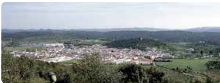
Alanís desde el Cerro de los Guindales