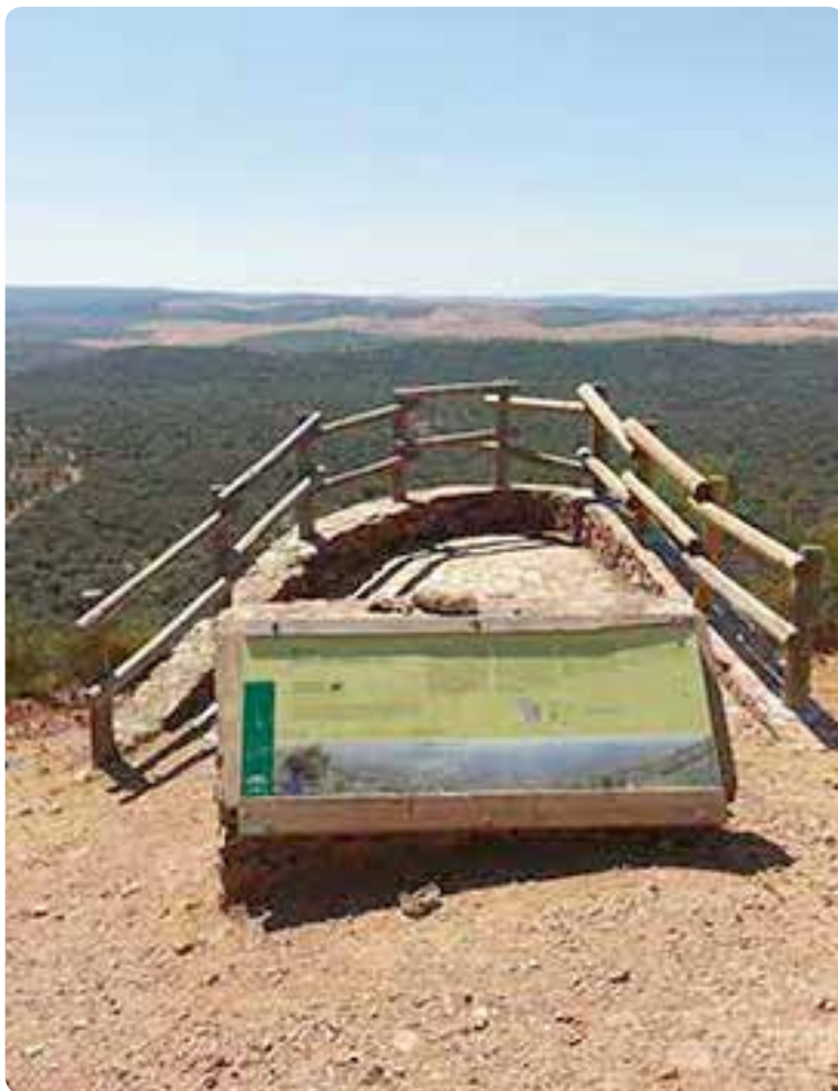
Mirador del Cerro del Calvario.

minar el alto del Calvario, rodeado de brezo, desde el cual se divisa el hermoso paisaje que hemos recorrido. La bajada hasta Almadén es corta pero muy pronunciada.