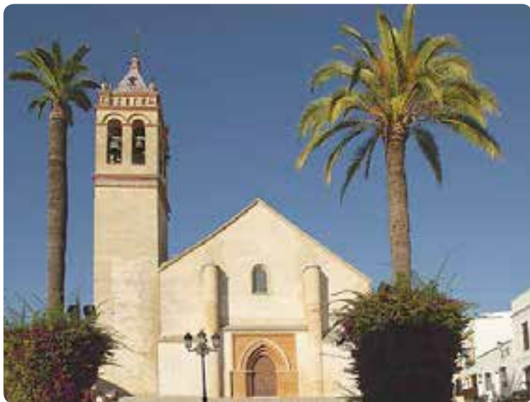
Iglesia de San Juan Bautista, Marchena.

Las huellas más antiguas corresponden a la edad de bronce (yacimiento de Montemolín). Este municipio es conocido por su importante conjunto monumental donde destacan el Arco de la Rosa , la Puerta de Sevilla , las iglesias mudéjares de Santa María y de San Juan Bautista con su Museo de Zurbarán, la de San Miguel y San Agustín , la Plaza Ducal , el convento de la Purísima Concepción , con sus típicos dulces, y las casas-palacio .