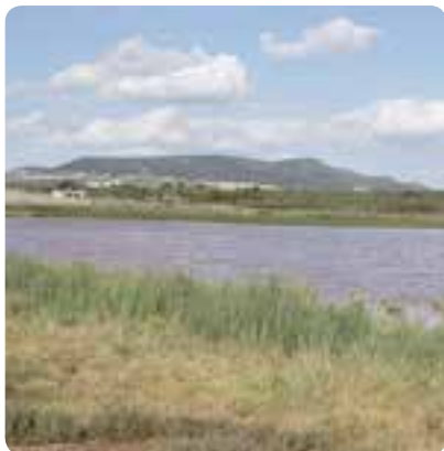
Laguna del Gosque, Martín de la Jara.

En sus cercanías está la Laguna del Gosque , habitat de un buen número de aves acuáticas. La laguna salada fue playa de los pueblos cercanos. La iglesia de Nuestra Señora del Rosario es su principal monumento.