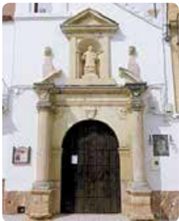
Ermita de San Lorenzo.