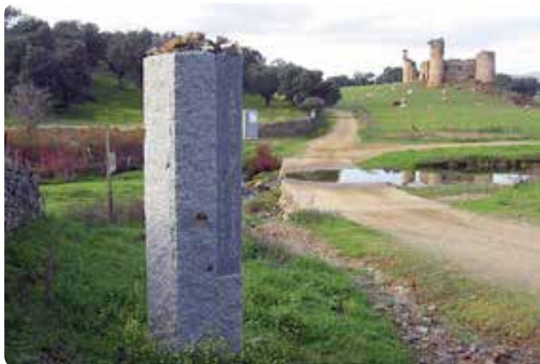
Vista del arroyo de la Vibora, límite entre Andalucía y Extremadura, y el castillo de las Torres.

Varios nuevos miliarios han sido colocados estratégicamente en cada término local, llevados a cabo conjuntamente por la Asociación de Amigos del Camino de Santiago Vía de la Plata con la Diputación de Sevilla.