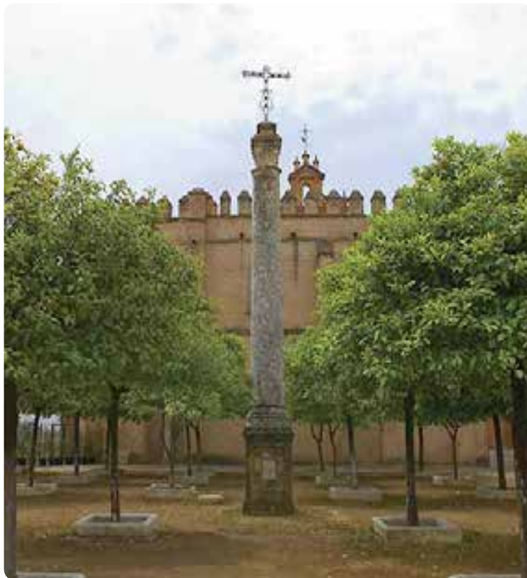
Monasterio de San Isidoro del Campo, Santiponce.

Dejamos Itálica a nuestra izquierda y de vuelta a la senda, una larga recta nos llevará entre trigales y olivos hasta Guillena.