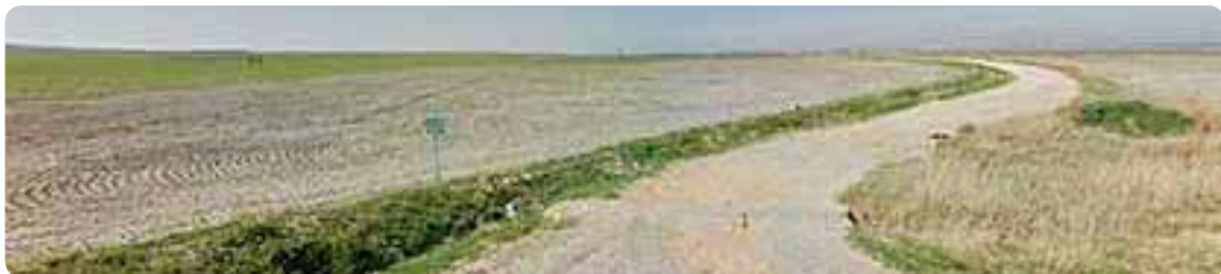
Arroyo Palomar, El Viso del Alcor.