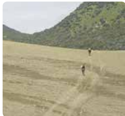
Peregrinos de Coripe a Montellano.