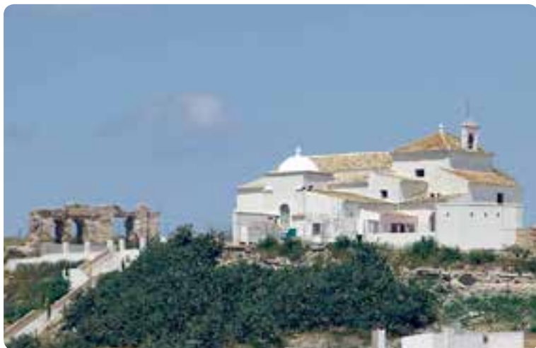
Ruinas del castillo y ermita de Santa María del Castillo, Lebrija.

Una vez atravesados los extensos campos de cultivo podremos disfrutar de distintos monumentos arquitectónicos como la iglesia parroquial Santa María de la Oliva , de estilo gótico-renacentista, con su torre similar a la giralda; el convento de San Francisco ; y la ermita del Castillo .