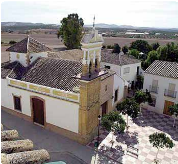
Iglesia de San Bartolomé, Aguadulce.

Tras penetrar puntualmente la Sierra Sur, emprendemos el viaje de nuevo hacia La Campiña, despidiendo el paisaje de Sierra definitivamente.