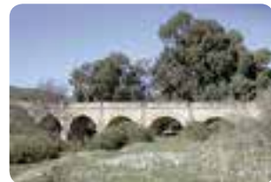
Puente «De los seis ojos».

Entre sus edificaciones de interés destacan la iglesia parroquial de San Juan Bautista y los puentes «De los seis ojos» y de la Solana .