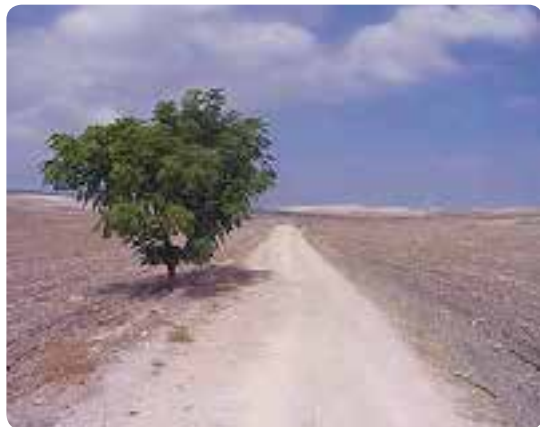
Partiendo de El Coronil.

En Coripe llegamos a la plaza de San Pedro con la iglesia del mismo nombre, donde se recibe el sello para la credencial de peregrino. Pronto la antigua calle se hace un camino de tierra, atravesaremos el arroyo del Boquinete, tras el cual, el camino vira a la derecha y asciende. En algunos puntos, puede ser rocoso y pedregoso. Poco después volveremos a descender, y atravesamos el arroyo de Gilete que transcurre sobre el Camino, se vuelve a subir, pierde de nuevo altura y se encuentra con la carretera, seguimos a la izquierda hasta un cruce, tomamos a la derecha el cordel de Morón y Algodonales que nos lleva entre alambradas algo más de un kilómetro hasta que a nuestra izquierda sale un sendero que nos dirigirá hasta el cortijo de la Fuensolana, una vez allí tomaremos dirección norte para llegar a una confluencia de caminos. El que hemos de tomar es el menos perceptible, y gira a nuestra derecha por un valle ancho donde el trayecto gana altura. Una vista atrás en el paisaje con colinas y montañas merece la pena. Cuando hemos llegado arriba continuamos a la izquierda hasta un edificio, allí comienza a la izquierda un camino vecinal, llegando por un carril al arroyo de la Mujer. Lo seguimos a la izquierda, que se convierte en un claro camino del trayecto ancho. Más adelante el trayecto se hace de nuevo plano,