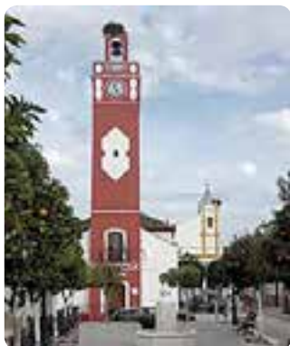
Torre del Reloj, Almadén de la Plata.