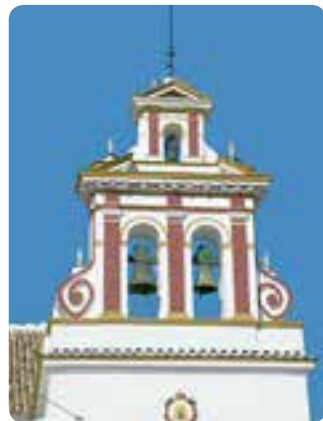
Espadaña de la iglesia de la Virgen de la Granada, Guillena.