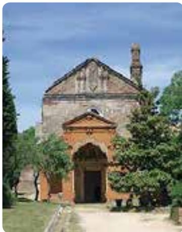
Monasterio de la Cartuja de Cazalla.