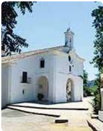
Santuario de la Virgen del Monte.