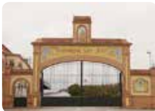
Cooperativa de aceites San José.

En Estepa se han encontrado restos arqueológicos de asentamientos anteriores a la dominación romana. Cuenta con varios monumentos de gran valor arquitectónico y excelentes miradores con vistas a la campiña. ( Camino de Antequera página 39).