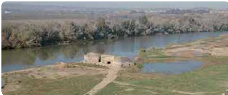
Paraje de la Aceña, Alcolea del Río.

Bordeando el curso del Guadalquivir, en el recodo donde a su caudal se le suman las aguas del Corbones, está Alcolea del Río, que conoció las prósperas ciudades romanas de Canama y Arva . Sobresalen aquí unos molinos en el paraje de la Aceña; la iglesia de San Juan Bautista ; y la gracia de las paredes irregulares de sus casas, blancas y cuajadas de geranios.