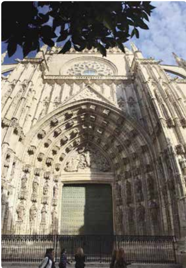
Puerta de la Asunción, catedral de Sevilla.