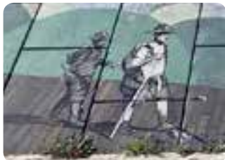
Mural de despedida en Sevilla.