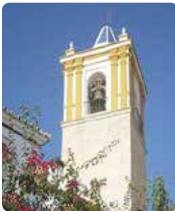
Torre de la iglesia de Sta. María del Alcor.