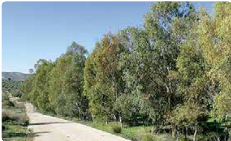
Entorno Sierra Sur-La Campiña.