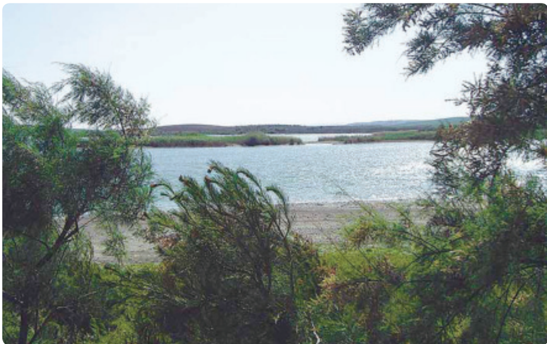
Balsa de Melendo, Lebrija.

Este camino se incorpora a la provincia sevillana en la población de El Cuervo, localidad, que como todos sabemos, es límite de ambas provincias. Hemos dejado atrás los viñedos jerezanos pero no totalmente ya que la incorporación a la localidad la hacemos bordeando los viñedos de la finca Santa Lucía. Nos dirigiremos a continuación a la ermita de Nuestra Señora del Rosario y desde allí entraremos en la localidad de El Cuervo de Sevilla . Atravesaremos por su avenida principal, que coincide con la N-IV, y paralelamente a esta carretera dirección Sevilla tomaremos en la intersección del pueblo un camino a la izquierda cruzando la carretera nacional, llamado camino de las Monjas , hasta encontrar una senda que sale a nuestra derecha, un poco más adelante daremos un leve giro a la derecha posteriormente a la izquierda y al final giraremos de nuevo a la derecha,