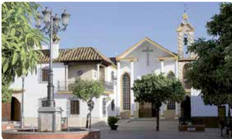
Iglesia parroquial de Santa Ana en la plaza del mismo nombre.