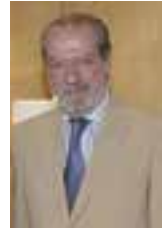
Fernando Rodríguez Villalobos Presidente de la Diputación de Sevilla