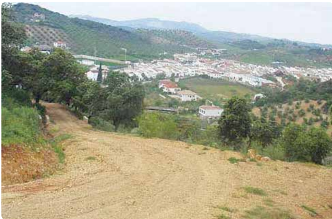
El Camino entrando en Coripe.

Sirva este proyecto caminero, peregrino y espiritual –que si bien, como ruta santiaguista, podría considerarse como innovadora– para la recuperación de un viejo itinerario que fue eje vertebrador del Sudeste sevillano.