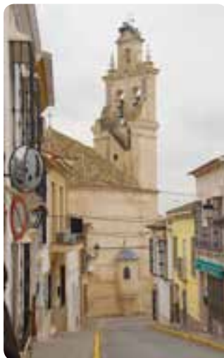
Iglesia de Ntra. Sra. de la Encarnación.

Serpenteando por los linderos meridionales de la provincia nos encontramos con este municipio cuyos orígenes históricos hay que buscarlos entre los celtíberos; fue entonces cuando se fundó la ciudad de Ventippo, 3 kilómetros al norte de la ciudad actual y en la orilla del Yeguas.