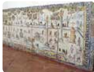
Convento de la Encarnación, Osuna.