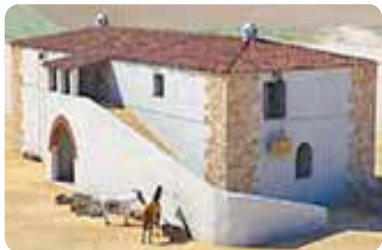
Recreación de La Almona.

Para terminar este camino de la Frontera por la provincia de Sevilla llegamos a Guadalcanal, nombre que procede del topónimo árabe «Guad-Al-Kanal». Aquí se asentó la Orden de Santiago en La Almona . Otros edificios visible son las iglesias de Santa María de la Asunción , de la Concepción y la de Santa Ana (actual Centro de Interpretación y Recursos); las ermitas de Guaditoca, San Benito y del Cristo del Humilladero . Este municipio es de gran tradición ceramista.