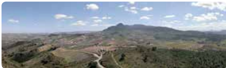
Vista de la Sierra Sur sevillana.