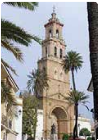
Iglesia de Sta. María de la Mesa, Utrera.