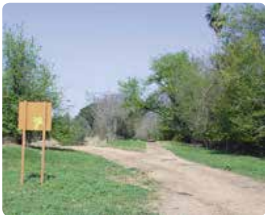
Camino de Don Rodrigo.

ahora es la vereda de Utrera , tras arbustos y coníferas con canto de pájaros, llegamos a una zona muy arbolada y frondosa cercana al antiguo cortijo de Don Rodrigo, de ahí a la carretera local SE-425 y seguimos a la derecha hasta que crucemos las vías del tren, entonces nos situaremos a la derecha. Continuamos el camino todo recto por el lado derecho del trazado del ferrocarril a la estación Cantaelgallo, entrando en Dos Hermanas . Por la calle Virgen de Valme llegaremos a la plaza de la estación de ferrocarril y continuamos de frente, por