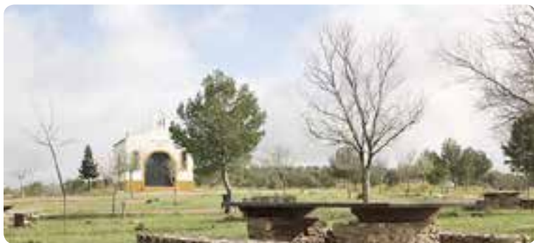
Ermita de la Virgen del Rosario, El Rubio.

Entre sus edificaciones de interés histórico-artístico destacan la iglesia de Nuestra Señora del Rosario y la ermita de la Virgen del Rosario en el Cerro de la Cabeza.