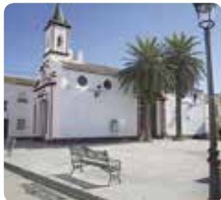
Iglesia de San Pedro Apóstol, Coripe.