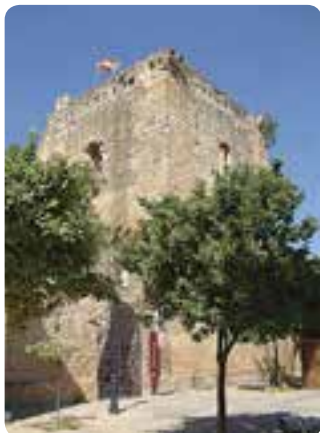
Torre del Homenaje, Utrera.