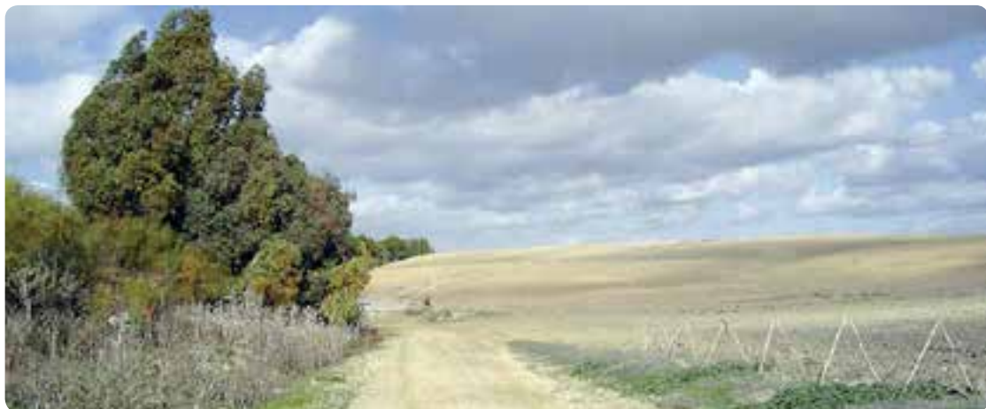
Camino Vía Augusta por la comarca sevillana Guadalquivir-Doñana.