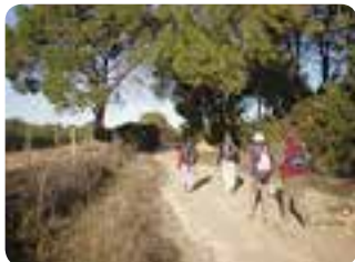
De Utrera a Dos Hermanas.