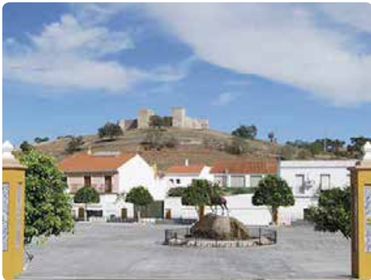
Plaza de Andalucía, al fondo el castillo, El Real de la Jara.