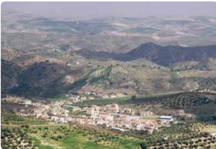
Vista general de Algámitas.