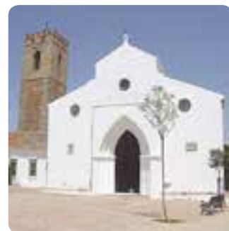
Iglesia de Santa María del Águila, Alcalá de Guadaíra.