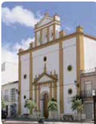
Iglesia de Santiago Apóstol, Los Corrales.