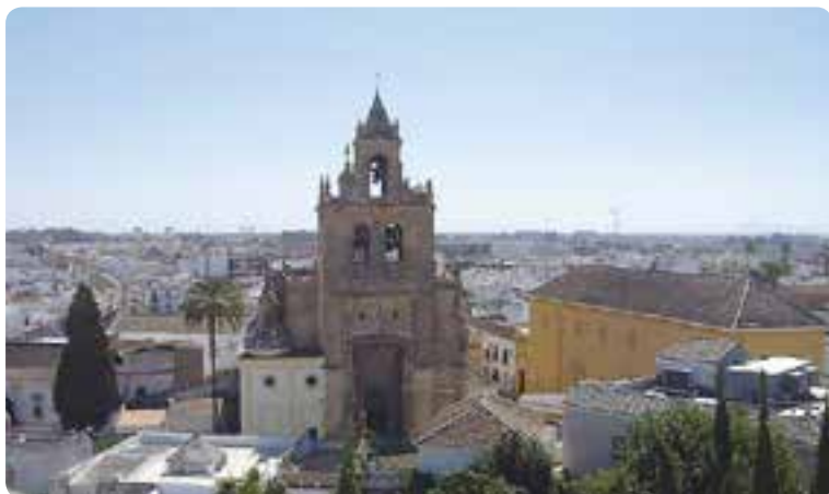
Iglesia de Santiago, Utrera.

Fue colonia romana y alcanzaría un gran esplendor bajo dominio musulmán (resaltando su judería). Además de los restos de un puente romano, entre sus monumentos civiles destacan el castillo , las murallas , el Arco de la Villa y el hermoso edificio renacentista del Ayuntamiento , antiguo palacio de los Cuadra. Por sus calles y plazas encontramos bellas fachadas y numerosas e importantes muestras de la arquitectura religiosa, como la iglesia de Santa María de la Mesa , que aglutina elementos góticos y barrocos; la iglesia de Santiago , espléndida construcción del gótico florido, con portada isabelina, y con una original veleta con la imagen de Santiago Matamoros; y la iglesia de San Francisco , con unos admirables frescos en la capilla mayor y un magnífico pórtico. Fundada es la fama que mantiene en toda la provincia por su repostería, en especial sus mostachones.