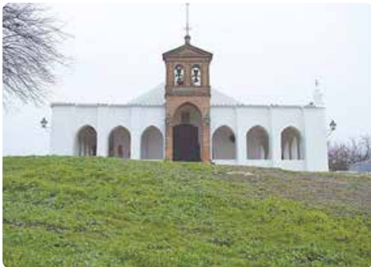
Ermita de Setefilla, Lora del Río.

Aparte de ser popular su artesanía de forjado y alfarería, cuenta con un vasto patrimonio histórico y cultural. En un paseo por sus calles asombran los balcones y fachadas de edificaciones señoriales, como el del Ayuntamiento , la Casa de la Virgen o la de los Leones ; sus plazas; y el bellissimo campanario de la iglesia mudéjar de la Asunción que destaca por sus portadas de ladrillo con baquetones y escudos, y por su orfebrería. Merecida mención tiene la iglesia de Jesús Nazareno , el convento de la Inmaculada ; y la ermita de Setefilla que acoge en septiembre una multitudinaria romería.