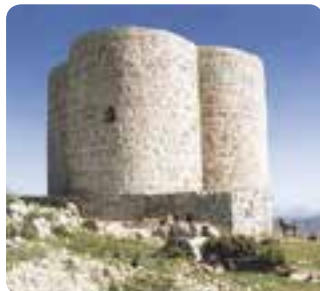
Castillo de Cote, Montellano.

En su entorno agreste se sitúa otra de las atalayas fronteriza, el castillo gótico de Cote , éste junto con la iglesia parroquial de San José , el convento de las Hermanas de la Cruz , la ermita del Cristo de los Remedios y sus casas solariegas , constituyen el mejor ejemplo de edificación monumental montellanesa.