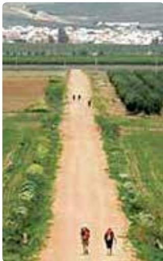
Entrando en Guillena.

Cuando los romanos conquistaron Hispania, al mismo tiempo que expoliaban la gran riqueza minera de sus canteras, fueron desarrollando una compleja red de calzadas para unir sus principales ciudades. Una de estas calzadas, la Vía Augusta, la Ruta de la Plata, atravesaba esta comarca, en la zona noroccidental de la provincia de Sevilla, comunicando la Bética con la Lusitania.