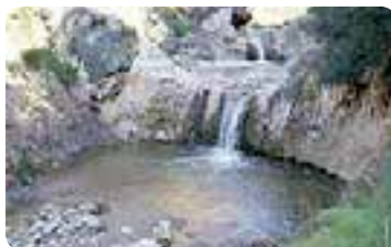
Paraje Natural «El Búho».

De interés histórico-artístico, destacamos en la Villa, la ermita Nuestra Señora del Carmen , la ermita del Santo Cristo de la Sangre y la iglesia parroquial de San Sebastián .