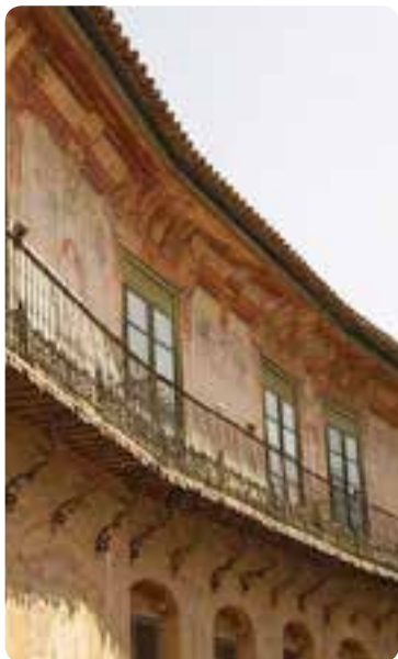
Palacio mirador de Peñaflor, Écija.

En la visita a Écija (Conjunto Histórico-Artístico desde 1966), es fundamental ir a las Torres de la Concepción , la Plaza Mayor y el valioso ajuar de su veintena de iglesias y conventos , que albergan numerosísimas obras de arte en su interior y que visten a la ciudad de espadañas, torres, campanas y nidos de cigüeñas. Hermosa es la silueta recortada por un bello conjunto de torres góticas, mudéjares, renacentistas y barrocas.