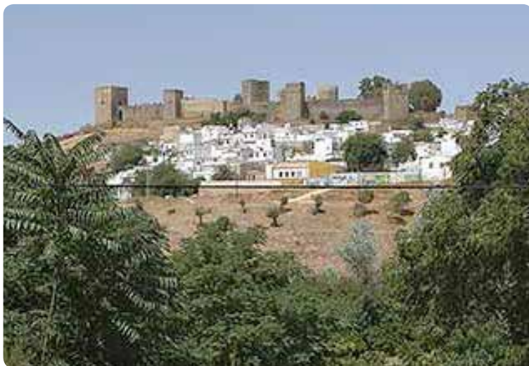
Castillo de Alcalá de Guadaíra.