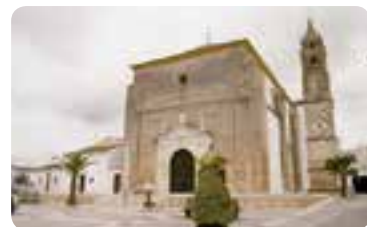
Iglesia parroquial de San Sebastián.