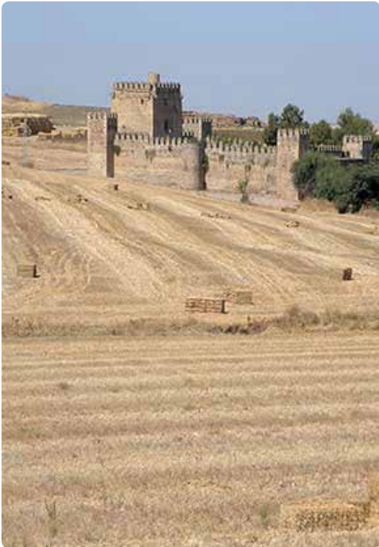
Castillo de las Aguzaderas, El Coronil.