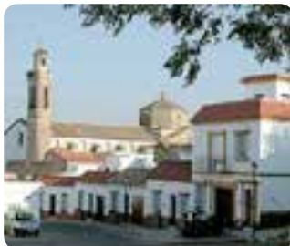
Convento de San Sebastián.

De su patrimonio artístico hay que conocer la iglesia de Santa María la Blanca del siglo XVI, con un retablo y una talla de Alonso Cano y hermosos elementos decorativos; la iglesia de San Sebastián , de líneas barrocas; y la ermita de San Lorenzo , con un zócalo de azulejos del siglo XVIII, un crucificado del XVI y una bella cúpula decorada con yeserías en el interior.