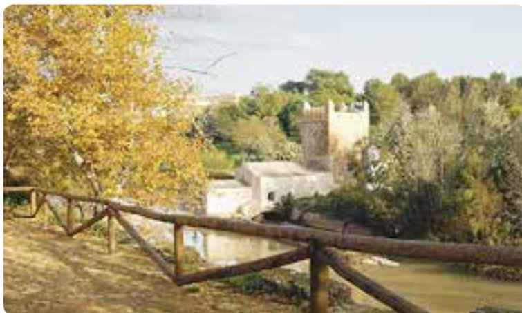
Molino del Algarrobo, Alcalá de Guadaíra.

Atesora interesantes muestras de arquitectura, como el punte romano o el castillo , con sus once torres. Destacar, como no, la iglesia de Santiago , las de San Sebastián y Santa María del Águila . En el cercano Gandul se ha localizado una necrópolis megalítica con ochos dólmenes dispuestos en abanico. También se conservan numerosos molinos que se remontan a época de los griegos, aunque la mayoría son posteriores de tiempos de al-Andalus, que dan fama a sus conocidos panes y tahonas.