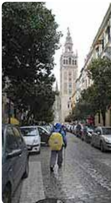
Dos momentos al final de la Vía Serrana, en el campo y en la ciudad de Sevilla.