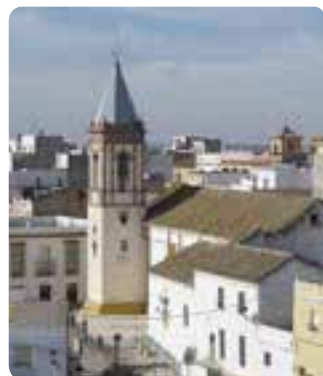
Iglesia de Santa Marta, Los Molares.