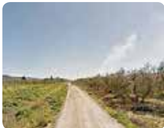
De Osuna a Marchena.