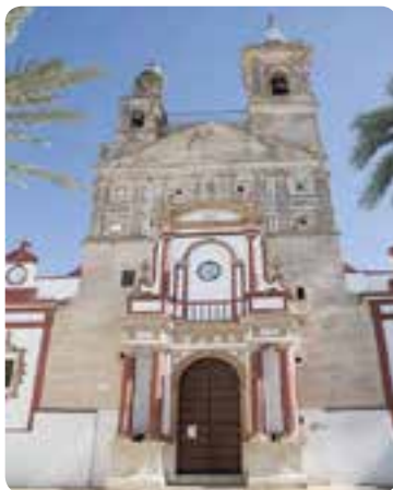
Iglesia de Santa María la Blanca.