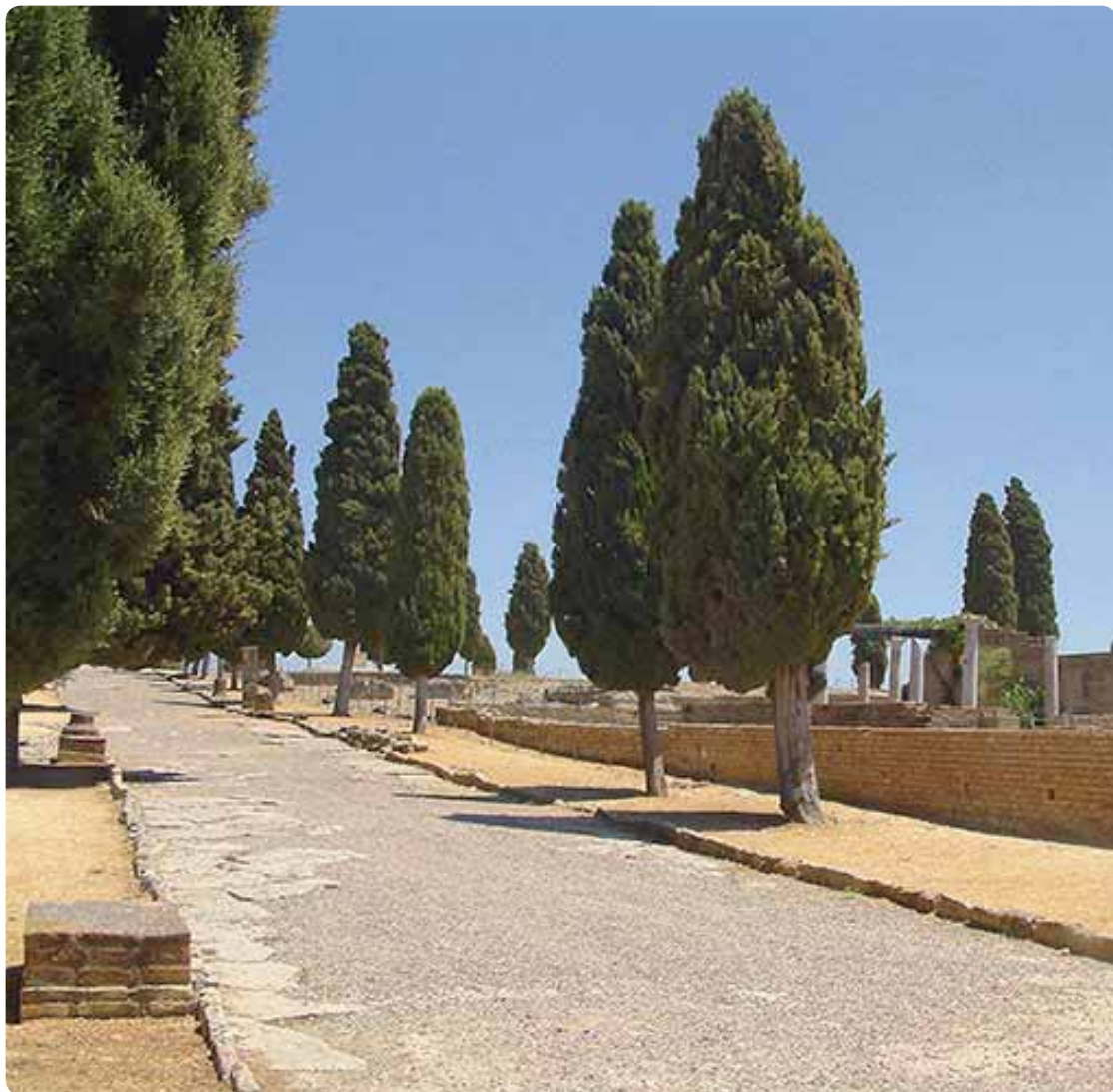
Casa de los Pájaros, Conjunto Arqueológico de Itálica, Santiponce.