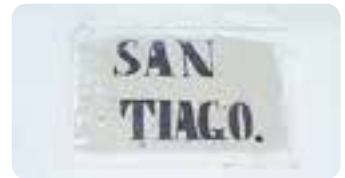
Antiguo rótulo del callejero santiaguista.

Durante la dominación árabe, constatamos que pervive la comunicación viaria entre todos estos territorios, de la que se hacen eco los geógrafos árabes y otros viajeros. Reconquistada Niebla en 1260, el Rey Sabio jugó un trascendental papel en la administración y repoblación del territorio. En los sucesivos repartimientos, casi todo el oeste de España 3 iba a conformar un a modo de limes Sancti Jacobi , que, en algunos lugares, iba a persistir hasta finales del siglo XIX 4 . Las numerosas encomiendas santiaguistas que jalonan la provincias de Sevilla, nos llevan a proponer una RUTA JACOBEOA, que recupera parte del viario, que era recorrido por los peregrinos con dirección a Santiago y que, a la inversa, por los Visitadores de la Orden santiaguista 5 .