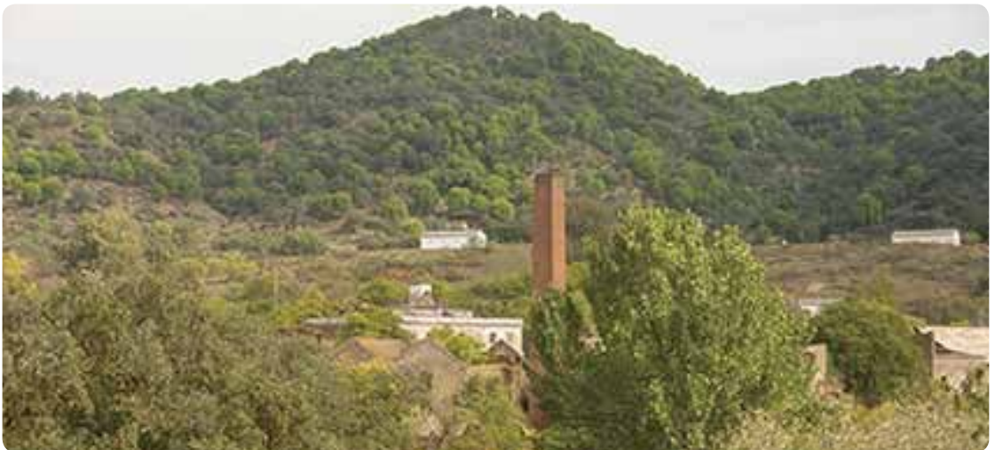
La Fundación, El Pedroso.

En la villa minera cruzamos la riera del Huéznar por el caserío de Guadalquivir hacia el cordel de El Pedroso. Pasaremos por el apeadero de Las Arenillas, las ruinas del apeadero de Ventas Quemadas, la casa de la Mina y el cortijo del Puerto del Cid hasta el cordel de