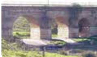
Puente de Piedra, Aguadulce.