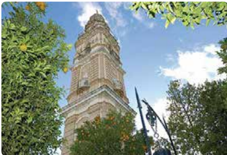
Torre de la Victoria, Estepa.

Sobresalen sus edificios religiosos como las iglesias de la Asunción, San Sebastián y del Carmen , y el convento de Santa Clara . De la arquitectura militar subsiste la santiaguista Torre del Homenaje . Cuenta con excelentes miradores con vistas a la campiña. Estepa aúna en su localidad historia, paisaje y gastronomía. Lo más representativo son su aceite de oliva (DO), mantecados y polvorones (IGP), que junto a los roscos de vino, alfajores y demás dulces completan una oferta muy apreciada en todo el mundo.