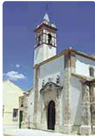
Iglesia de Santa Ana.

Este municipio forma parte de la Ruta de Washington Irving, vía comercial entre el sur peninsular cristiano y el reino nazarí de Granada. Entre sus edificaciones destacan la iglesia parroquial de Santa Ana y la capilla del convento de las Siervas del Evangelio .