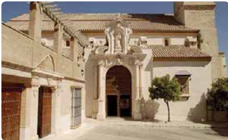
Iglesia de San Sebastián, Estepa.