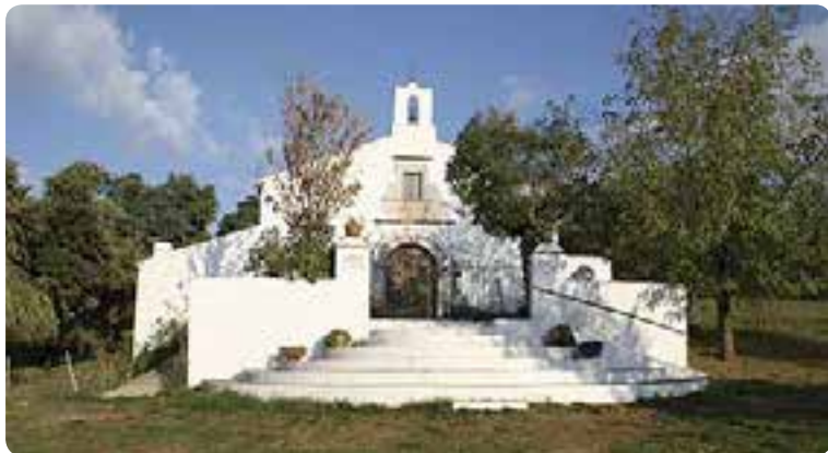
Ermita de San Diego.