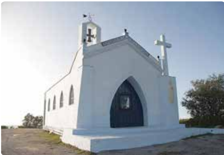
Ermita de la Pura y Limpia Concepción, Pruna.