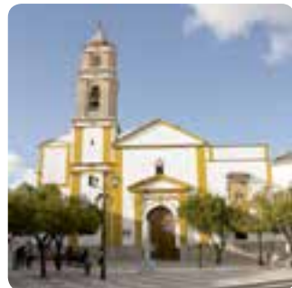
Iglesia parroquial de San Marcos.

Su principal monumento es la iglesia parroquial de San Marcos (con un interesante retablo barroco), pero también es de interés la ermita de San José en Navarredonda, la Fuente del Moro en la aldea la Mezquitilla, la hacienda de San Pedro , el yacimiento ibero-romano de los Baldíos .