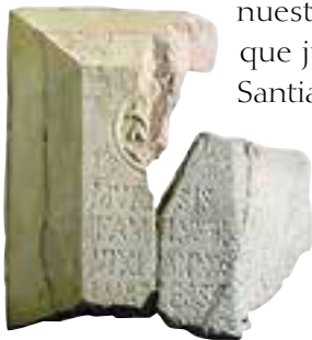
Lauda sepulcral de Murense (Museo de Huelva).

Desde tiempo inmemorial, existió un camino que unía la Raya de Portugal con la capital del Reino de Sevilla, a través de los dominios compartidos del Marquesado de Ayamonte y el Marquesado de Villamanrique. Esta vía que atravesaba el Condado de Niebla, iba a cobrar importancia, dado que parte de sus villas y lugares estaban administradas por la Orden de Santiago, tanto en lo material como en lo espiritual, como entidades de señorío: por tanto, la vinculación santiaguista era el mayor entronque con la inveterada costumbre de recorrer devocionalmente los caminos, en busca de la nueva Jerusalén, en nuestro caso, Santiago de Compostela, en donde se encontraba la meta que justificaba el esfuerzo del peregrino, esto es, la tumba del Apóstol Santiago.