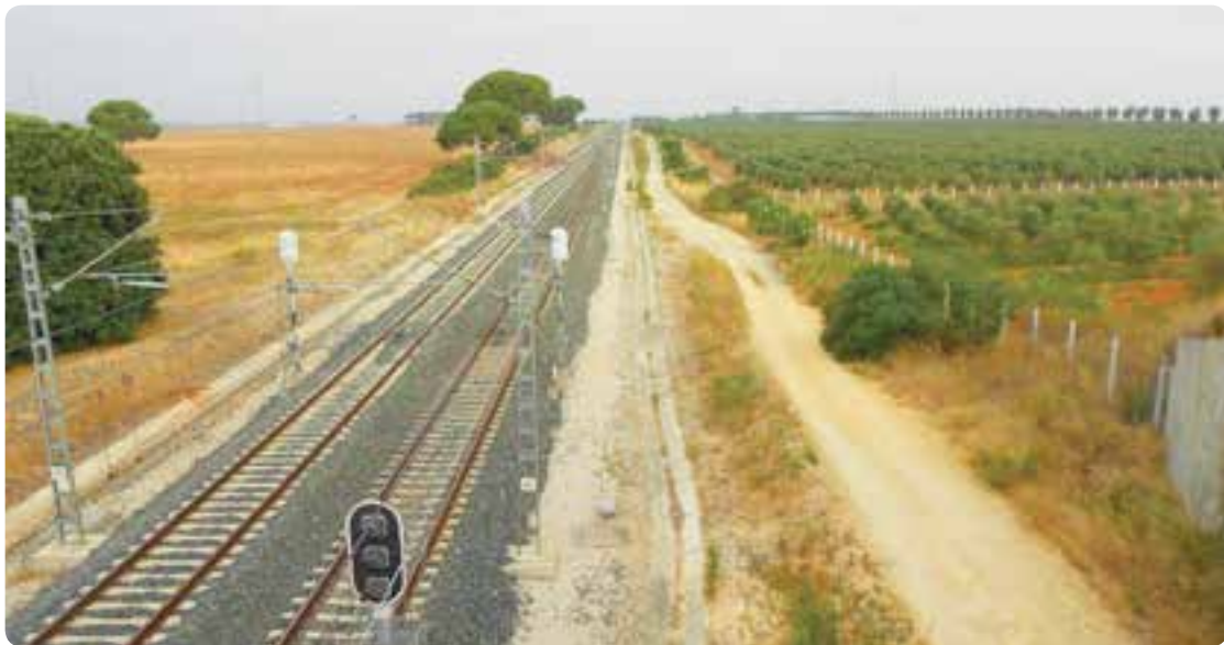
Trazado junto al ferrocarril.

las calles Sevilla, de la Libertad y Gabriel Miró hasta salir de la población por la ronda de Adolfo Suárez. Caminaremos hasta el hipódromo de Andalucía, cerca de Montequinto. Si hemos llegado a una elevación en la siguiente isleta, vemos ya ante nosotros, en la lejanía, Sevilla. Descendemos el sendero que sale oblicuamente a nuestra izquierda por un olivar, acompañados de una plantación de aceitunas y pastos. Poco después nos unimos a la vereda del Rayo , y atravesamos el canal del Bajo Guadalquivir , saldremos a la carretera del Pítamo, cruzando el canal del Guadaíra y el ferrocarril, rodearemos unas viejas instalaciones militares, pasando esta vez bajo las vías del tren, y salir a la avenida de Jerez. Solo quedan 5,7 kms. para que, a través de las avenidas de la Palmera, las Delicias, Roma y la Constitución, lleguemos hasta la Catedral de Sevilla.