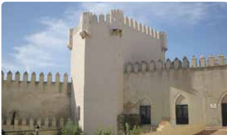
Castillo de Los Molares.

En Utrera nos encontramos con el Camino de Santiago procedente de Cádiz: La Vía Augusta . En esta ciudad, el peregrino podrá optar entre dos alternativas: por una parte el viejo Camino arriero medieval que le conducía a Alcalá de Guadaíra («Camino de Cuesta Carretilla»), o bien, recorrer la «Vereda de Utrera» para, por la antigua «mansio» romana de Oripo (Dos Hermanas), llegar a Sevilla.