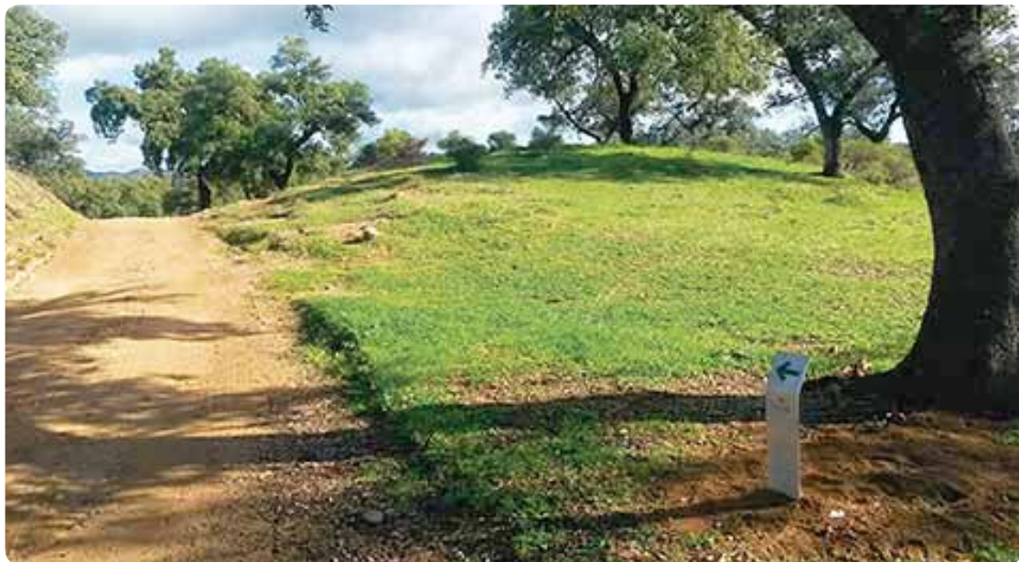
La cultura ibero-romana pasa por delante entremezclada con el paisaje.

La frontera de Granada o la Banda Morisca y el santiaguista Priorato de San Marcos de León conformaron y establecieron la antigua ruta jacobea del Camino de la Frontera. En época bajo-medieval entre las dos Andalucías existía un elemento de separación político y físico: la frontera . Ésta formaba parte del complicado esquema militar y diplomático establecido entre los reinos cristiano de Sevilla y nazarí de Granada, en este sentido, no hay razón para pensar en una situación bélica permanente. Instituciones típicas de la frontera eran los alhafteques y los fieles del rastro , dedicados al rescate de los cautivos, los primeros, y a la persecución de forajidos, los segundos. Al parecer, ambas corporaciones