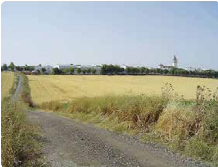
Entrando en El Coronil.

Abandonamos la Sierra Sur para enfilar el camino hacia la Campiña que nos llevará a Los Molares.