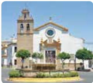
Iglesia de Sta. María de Gracia, Camas.