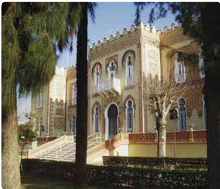
Palacio Alpérez, Dos Hermanas.