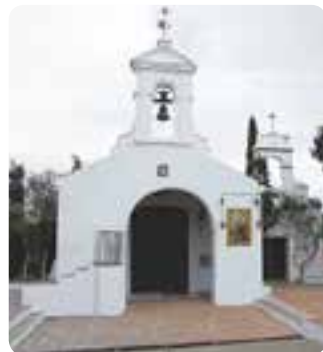
Ermita de San Benito, Castilblanco de los Arroyos.