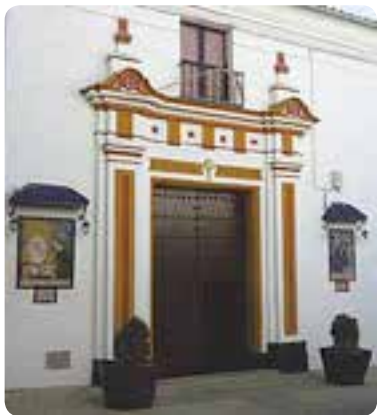
Convento del Corpus Christi.

Una vez que entremos en esta localidad nos envolverá el encanto de sus calles y casas cubiertas de azulejos. De interés histórico-artístico son sus casas-palacio , la torre neogótica del antiguo Consistorio, el convento del Corpus Christi , la iglesia de Santa María del Alcor y la capilla del Rosario .